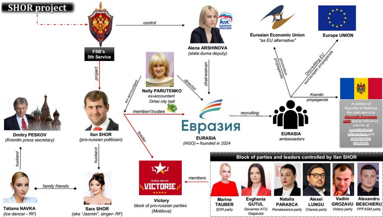
Schema 4. Schema relațională (generală) - proiectul „EVRAZIA”